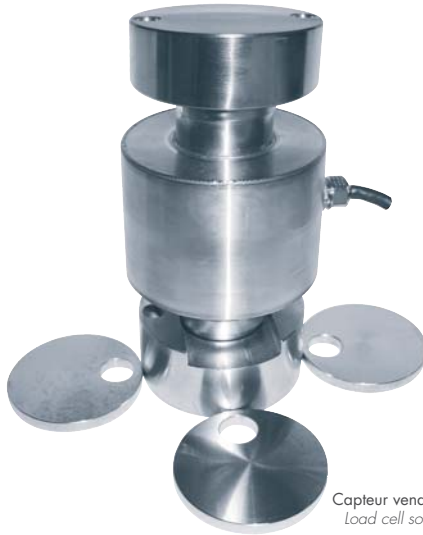
Capteur vendu séparément Load cell sold separately